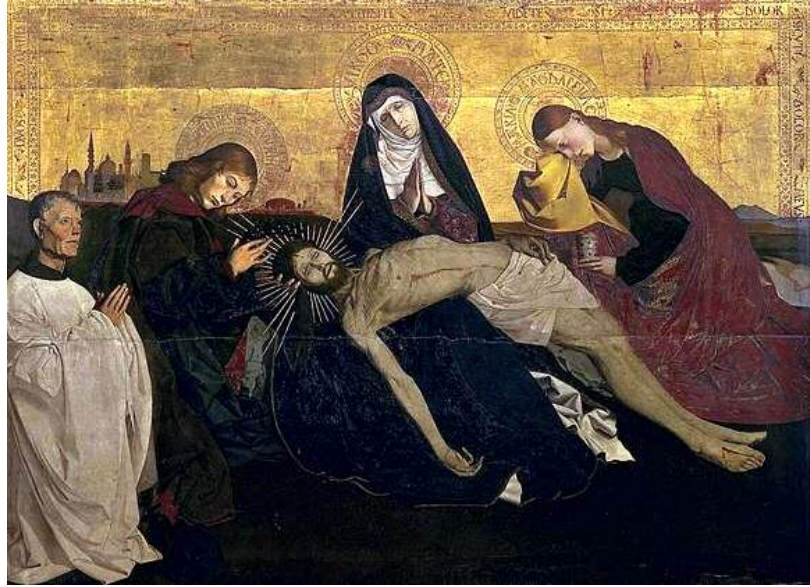
ئەنجیراند شارنتون Engurrand quarton

هونەری ئەوروپی سەدە گانی ناوەراستی و رینسانس ٢٦٣